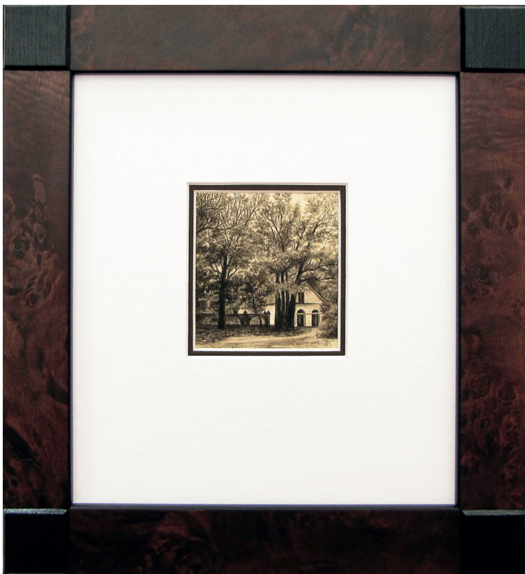
Fragment stajni, park w Natolinie, 2012r.