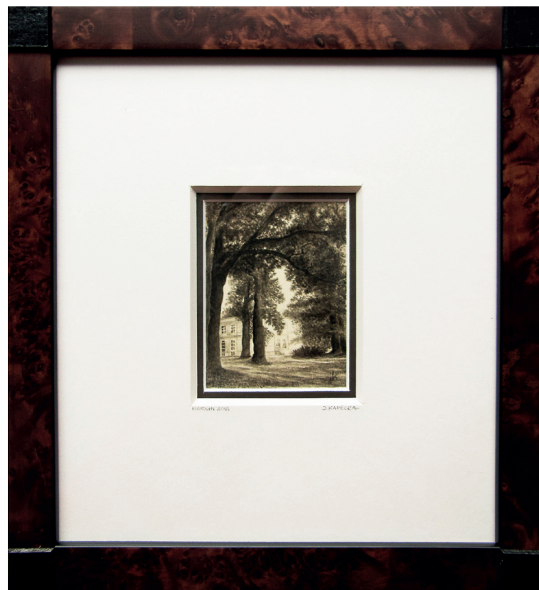
Fragment pałacu, Natolin, górny park, 2008r.