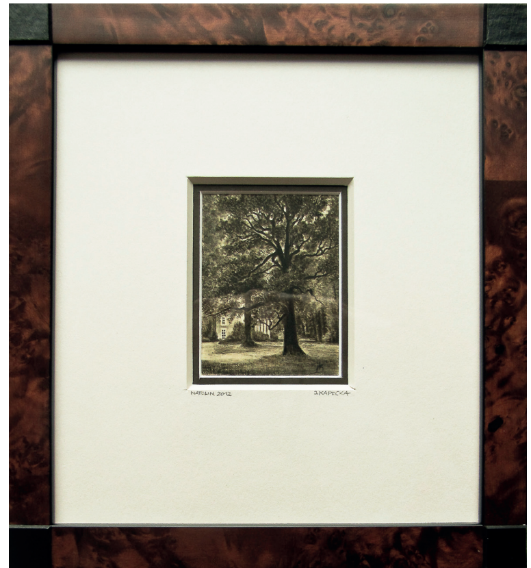
Fragment pałacu, Natolin, 2010r.