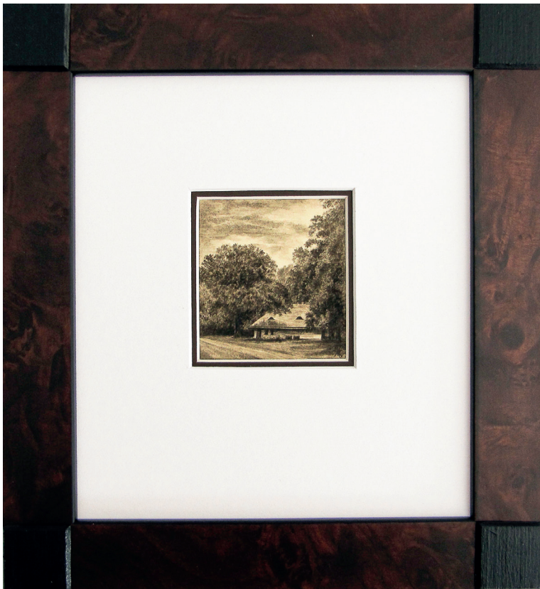
Stółówka studencka, College of Europe, Natolin, 2010r.